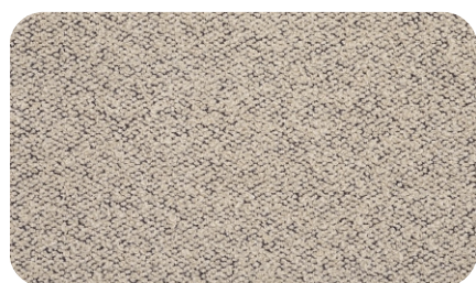
Perla col. 04