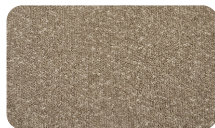
Perla col. 06