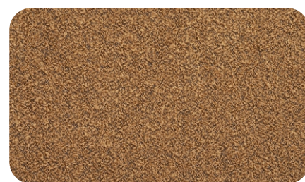
Perla col. 09