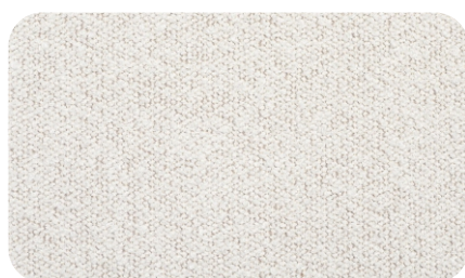
Perla col. 02