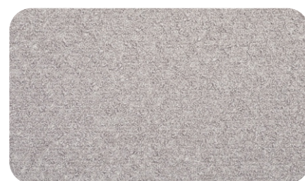
Perla col. 03