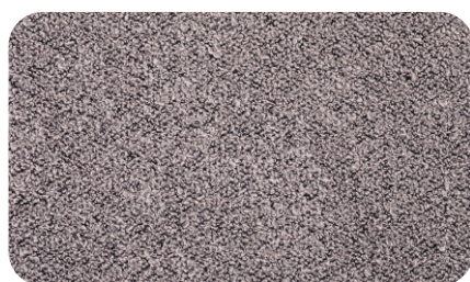
Perla col. 05