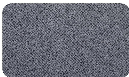
Perla col. 08