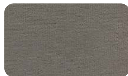
08 - серый