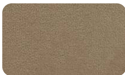
06 - капучино