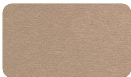
04 - бежевый