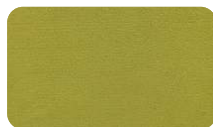
21 - оливковый