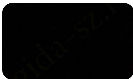
35 - черный