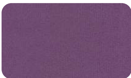
26 - сиреневый