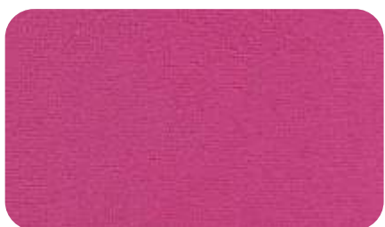
24 - розовый