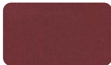
29 - кирпичный