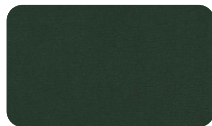
36 - зелёный